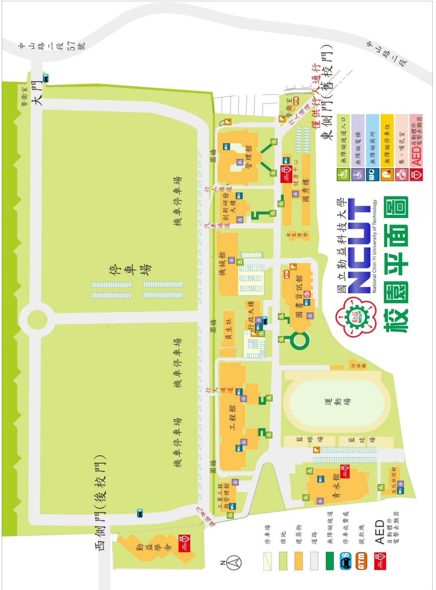
【附表十四】校園平面圖