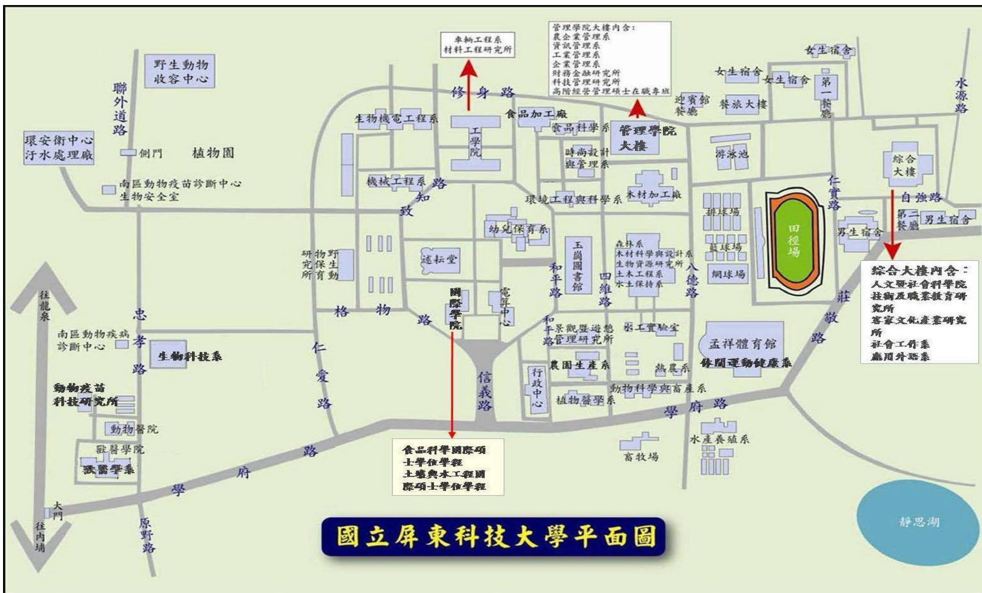
國立屏東科技大學平面圖