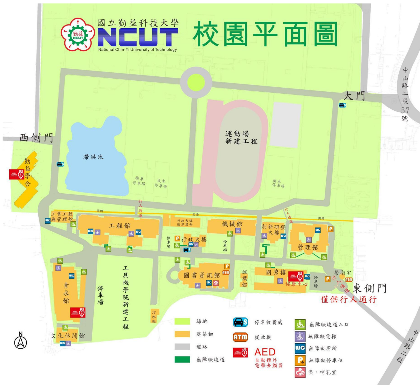
【附表十五】校園平面圖