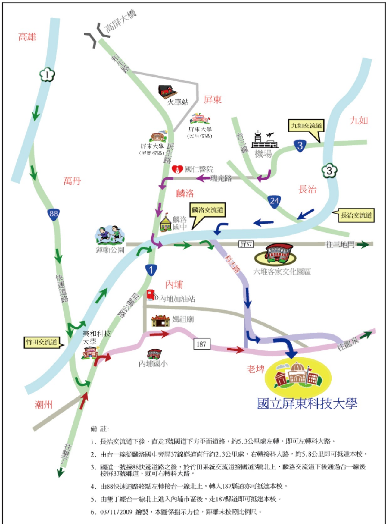
國立屏東科技大學位置示意圖