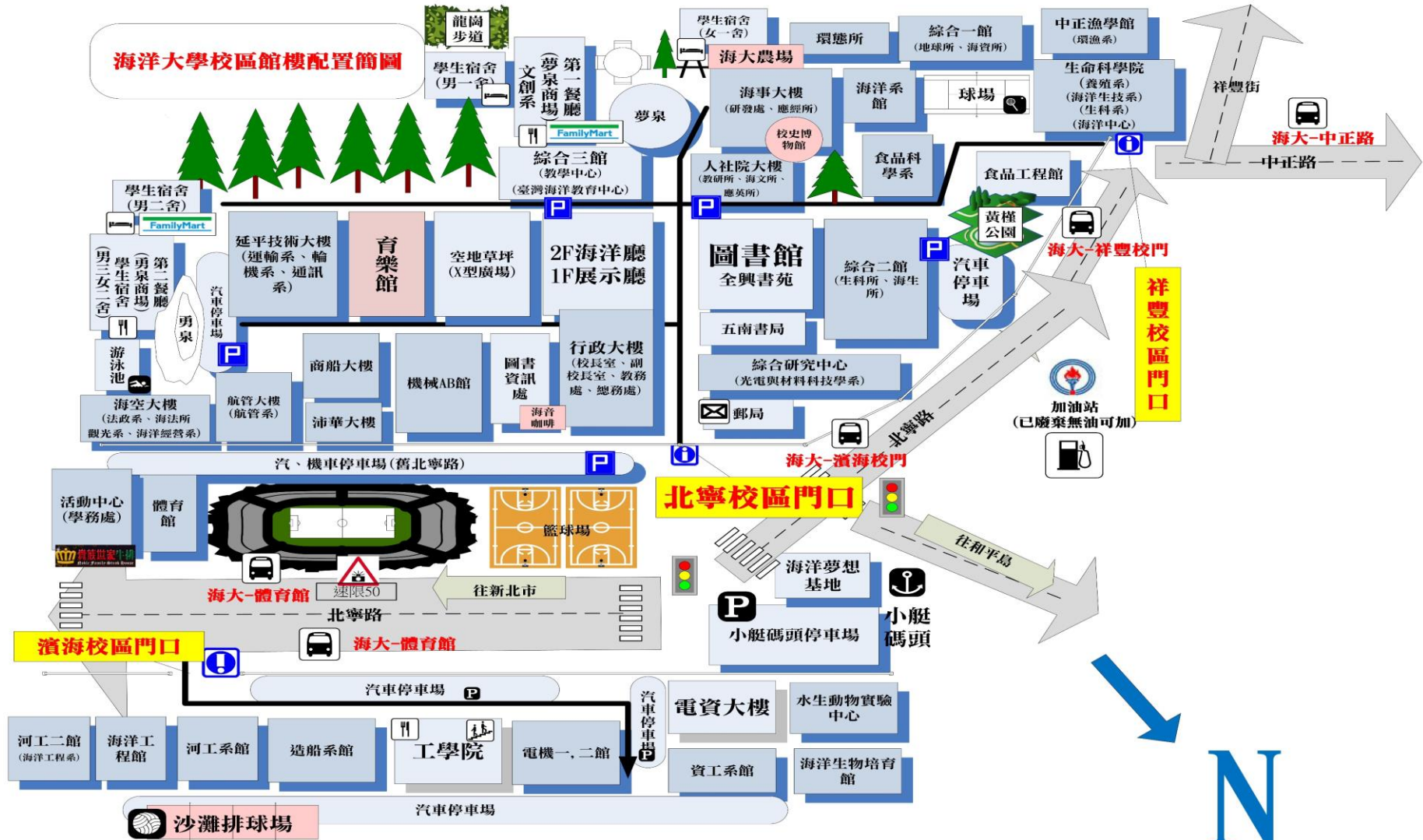
海洋大學校區館樓配置簡圖