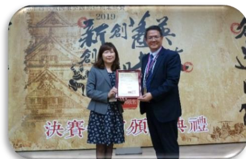
本校榮獲 2019 第十四屆戰國策全國創新創業競賽 創育機構推動獎