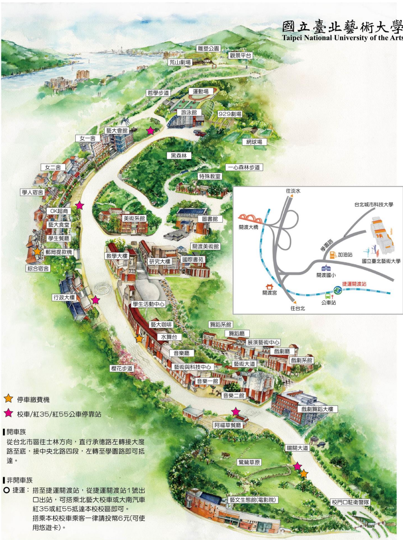
附圖一、本校交通情況及平面圖