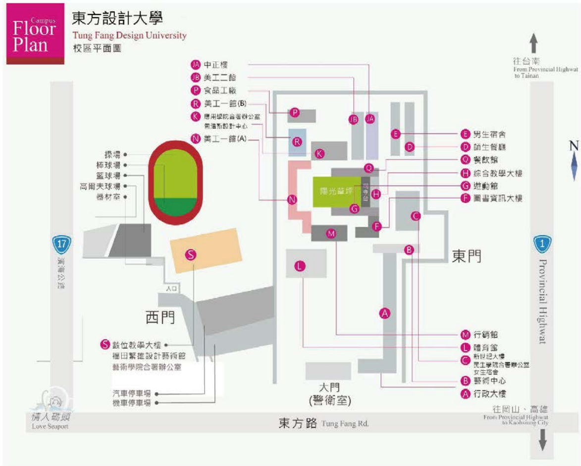
附表十六 東方設計大學校區平面圖