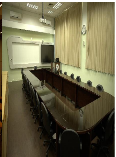
智慧商務虛實整合實驗室