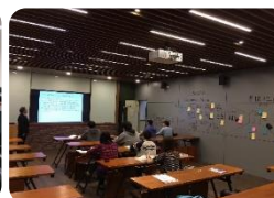
創新商業模式實驗室