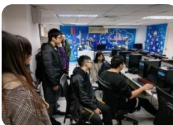
人工智慧與數位創新實驗室