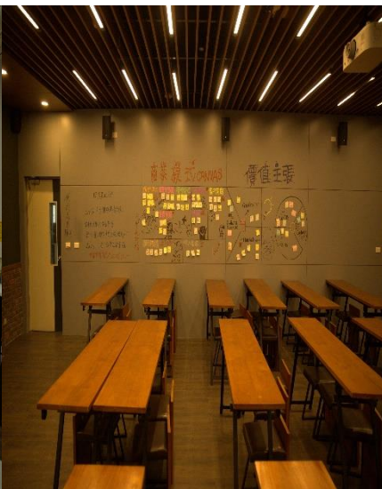
創新商業模式實驗室