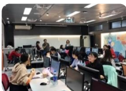
商貿智慧虛擬互動中心