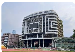
誠信館-全新落成多功能智慧教學大樓