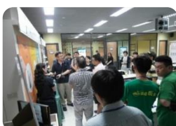
O2O 營運實驗室系統操作示範