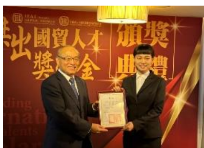
國貿系學生榮獲「傑出國貿人才獎學金」