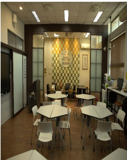
金融數位行銷實驗室