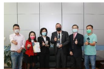
2023 富邦人壽管理博碩士論文獎