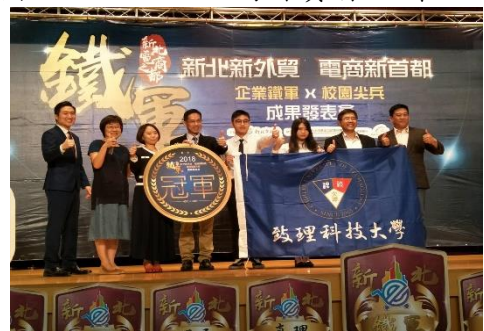
新北鐵軍培訓營(電商競賽)冠軍