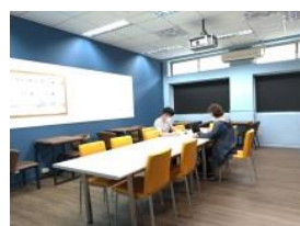
指導老師細心指導