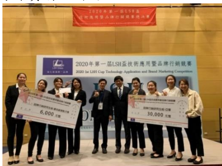
第一屆 LSH 盃技術應用暨品牌行銷競賽亞軍