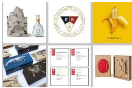
多設系學生榮獲「2023 年德國 iF 設計獎」