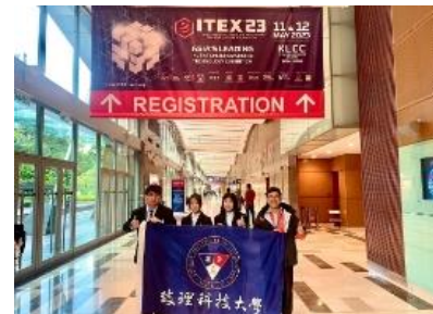
財金系榮獲「馬來西亞國際發明展 ITEX'23」金牌