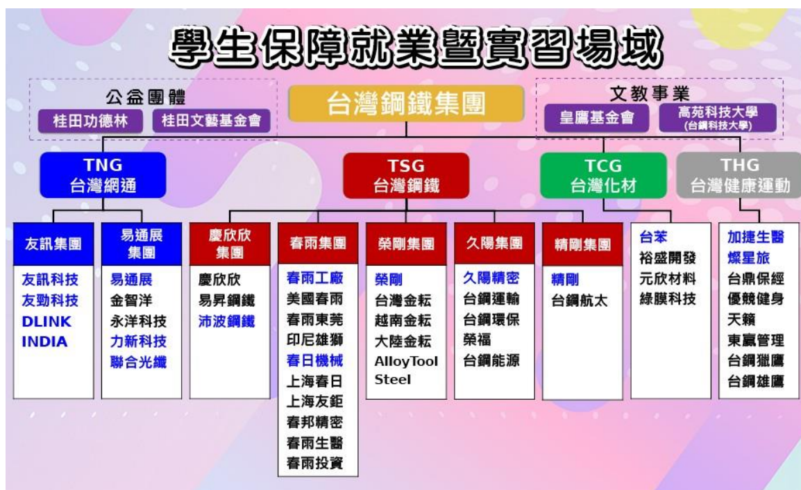
圖 1：台鋼集團企業、公益團體、文教事業之關係圖