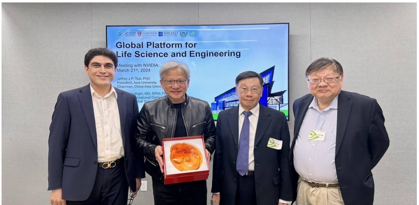
圖：亞大校長蔡進發(右 2)、美國哈佛大學醫學院 Alireza Haghighi 教授(右 4)、黃光彩講座教授(右 1)，前往 NVIDIA 總部，與 NVIDIA 創辦人黃仁勳(右 3)，針對智慧醫療領域深入交流。