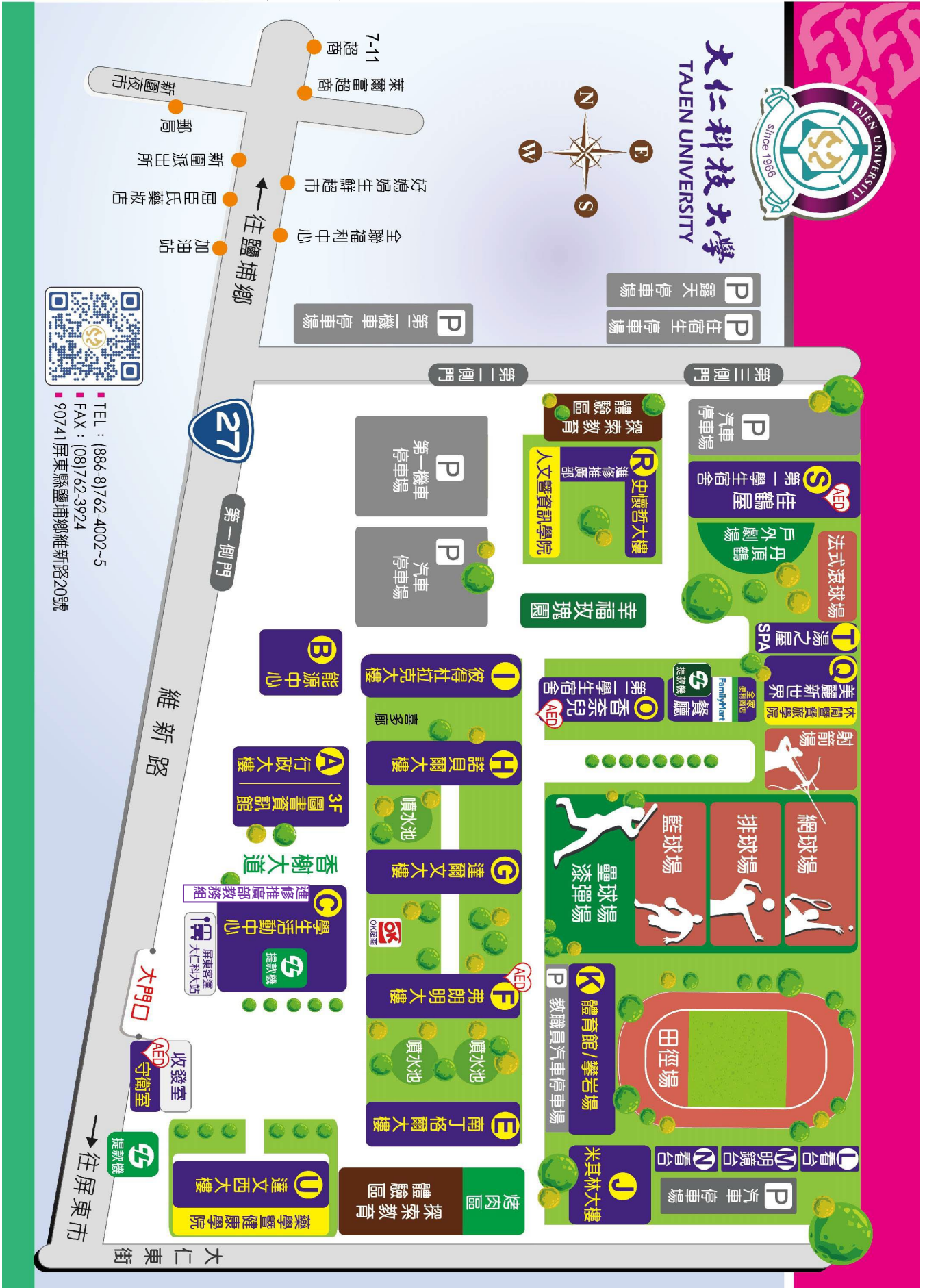
附件九 大仁科技大學校區平面圖